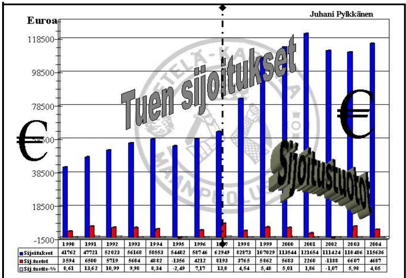
Liite 2 Tuen sijoitukset ja sijoitustuotot 1990 ... 2004